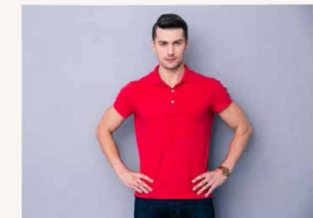
zbyt daleko od aparatu